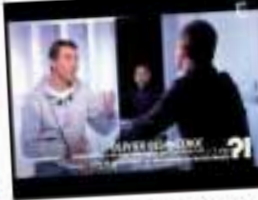
Olivier Besancenot invité de C50 direct (France 3)